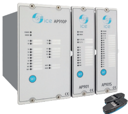
AP900 Relais de protection Arc Flash