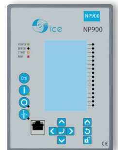
NP900 - CEI 61850 Relais de protection